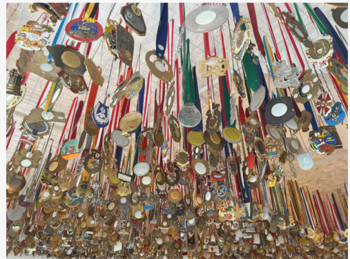
Orden im Haus des Karnevals