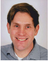
Philipp Schlee Bezirksbürgermeister philipp.schlee@ gruene-duesseldorf.de Bündnis 90/Die Grünen