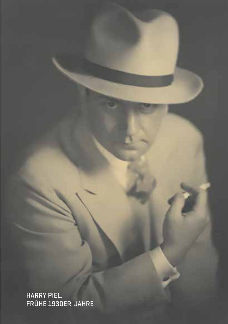
HARRY PIEL, FRÜHE 1930ER-JAHRE