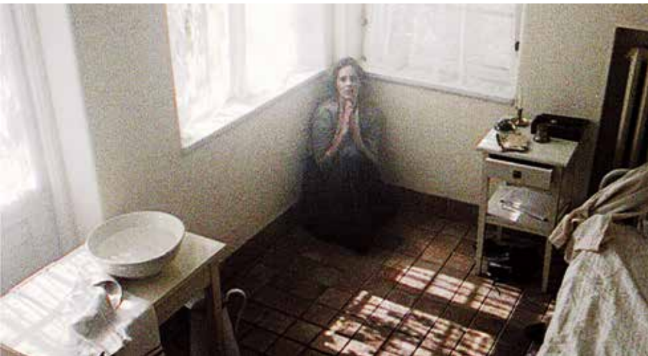
ICH HIESS SABINA SPIELREIN