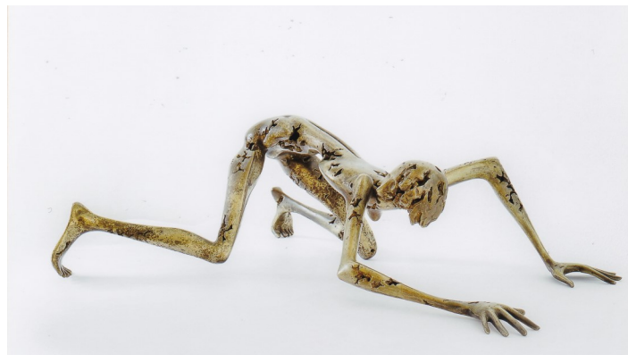
Spinne Wvz. 27