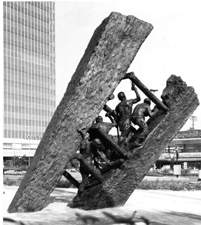
Steile Lagerung, Essen

Details hierzu finden Sie auf der letzten Seite.