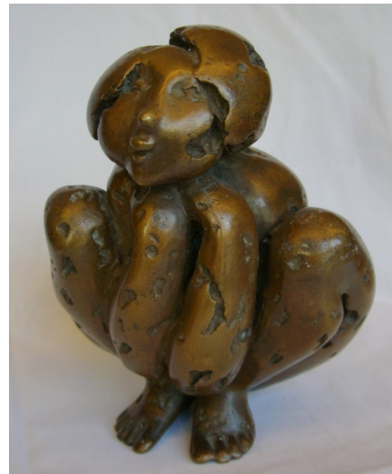
Mollige Wvz. 308