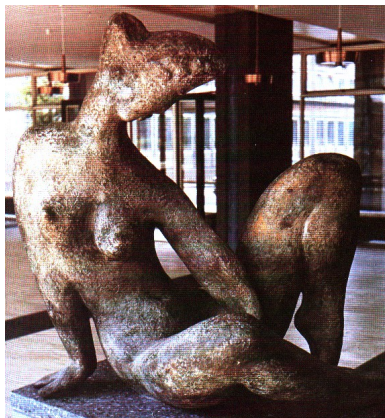
Weiblicher Akt, Chirurgie Uni-Klinik Düsseldorf