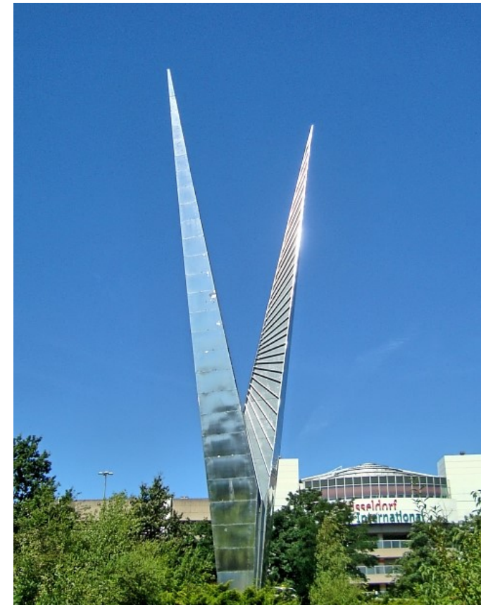
Ausstellungen im Kunstmuseum Solingen, Gräfrath und im Geburtszimmer, Stadtmuseum Düsseldorf.

Details hierzu finden Sie auf der letzten Seite.