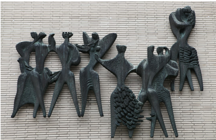
Finale, Theater Solingen