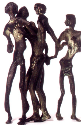
Beat – Tänzer unpoliert Wvz. 554