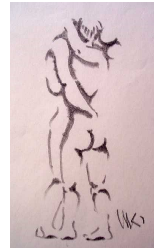
Zeichnung / Skizze