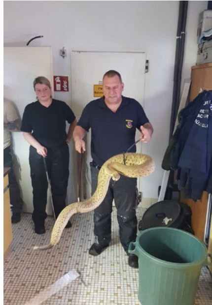
So wird eine Basilisken-Klapperschlange eingefangen

lernten so den richtigen Umgang mit Riesenechsen. Da Leguane messerscharfe Krallen haben und sich mit diesen versuchen überall festzuhalten, ist das Tragen einer dicken Jacke und Handschuhe obsolet, um so schwerwiegenden Verletzungen vorzubeugen. „Schlange ist nicht gleich Schlange“, war