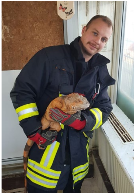
Handlingübung mit einem Leguan

unterschiedlichsten Tiere wurden durch die Ausbilder vermittelt. Ebenfalls erörterten die Teilnehmer die verschiedensten Giftarten, deren Wirkmechanismus und die unterschiedlichsten Arten von Antiseren. Weitere wichtige Bausteine für eine fundierte Ausbildung und spätere kompetente Arbeit sind Kenntnisse