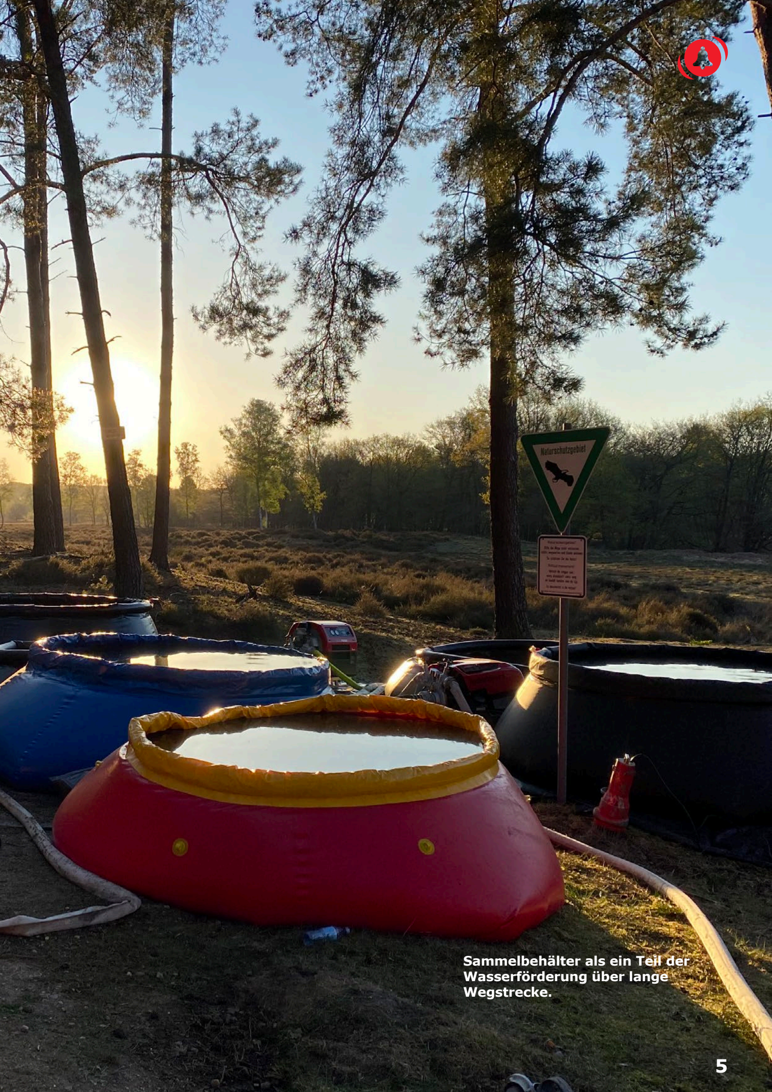
Sammelbehälter als ein Teil der Wasserförderung über lange Wegstrecke.