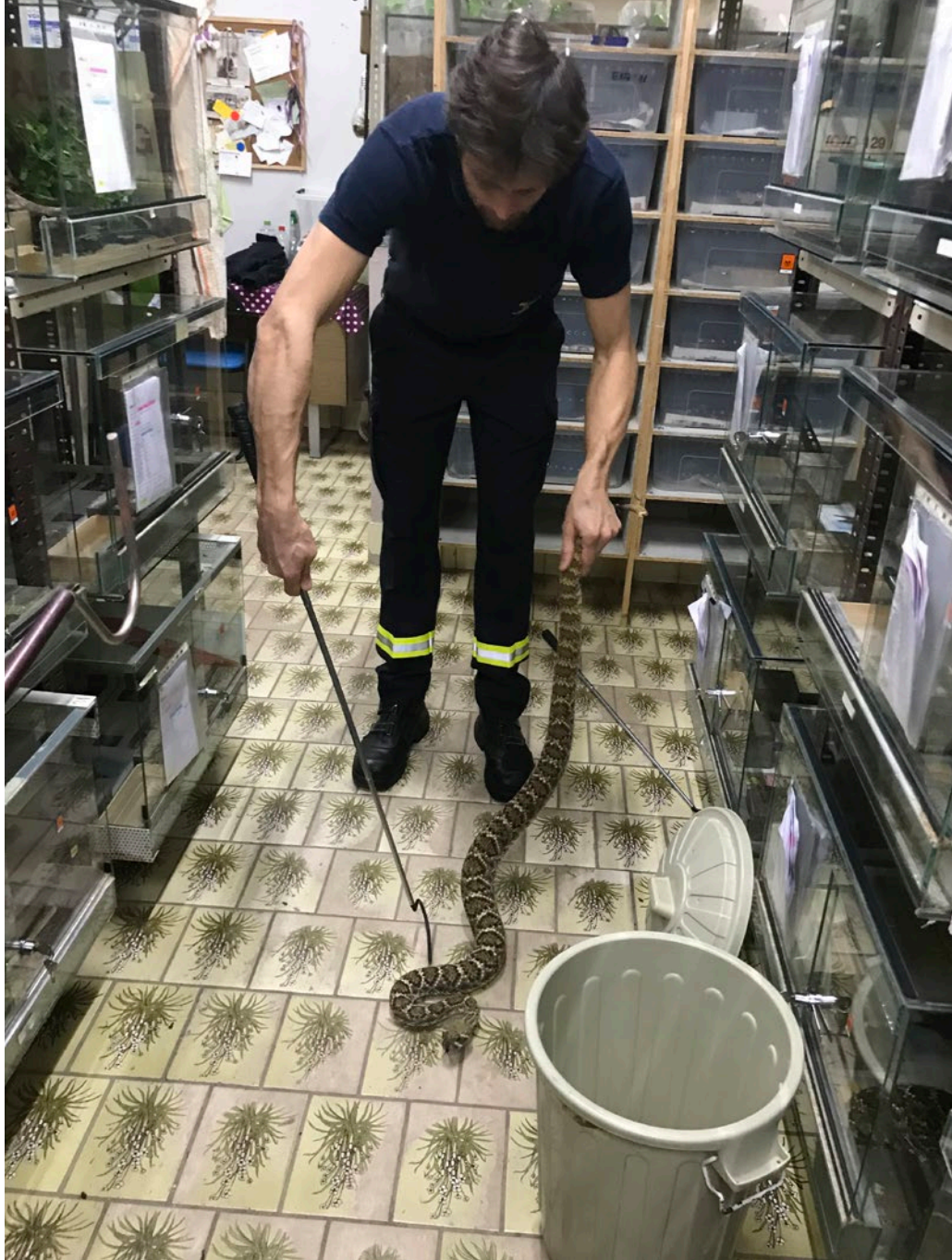
Die ersten Versuche beim Tailen

takt erfolgte für die Teilnehmer mit einer Echse. Dieses durchaus friedliche Tier wurde auf der Hand der zukünftigen Fachleute beobachtet und gemeinsam in der Gruppe die Unterschiede zwischen Schlangen und Echsen anhand der zu beobachteten anatomischen Unterschiede wie Augen, Ohren und Gliedmaßen erforscht. So ein direkter und enger Körperkontakt ist, was zu erwarten war, nicht bei allen Arten angezeigt. Vor allem im Umgang mit Schlangen kommt es auf eine professionelle und adäquate Ausrüstung an, dessen sichere Handhabung gezielt trai-