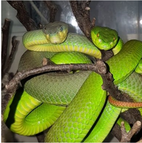
Zwei Bambusotter auf der Hut vor den Fängern

bei allen Beteiligten ein wenig nach – Kornnattern zählen nicht zu den Giftschlangen. Die ersten Übungen bestanden darin, die Schlange zunächst mit einem, später mit zwei Schlangenhaken aus dem Terrarium zu holen. Diese Einstiegsübung absolvierten die zukünftigen Experten mit Bravour, sodass sie ihre Handfertigkeit an weiteren ungiftigen Exemplaren trainierten. Es galt viele Unterschiede wie Größe, Aktivität und Angriffslustigkeit zu beachten. Im weiteren Verlauf der Ausbildung ging es dann Schritt für Schritt zu