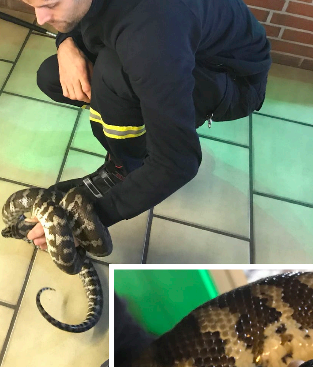
Im festen Griff – eine Teppichpython