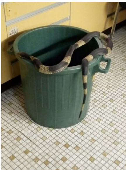
Eine Kobra versucht aus ihrem provisorischem zu Hause zu entfliehen

ein Merksatz, der sich bei allen Lehrgangsteilnehmern festigte. Dies wurde allen bei einer der letzten Übungen erneut bewusst: Es galt, eine Basilisken-Klapperschlange einzufangen. Dieses deutlich wuchtigere Exemplar von übler Laune, mit lautem Rasseln und Schnappen nach dem Haken stellte alle Teilnehmer vor eine große Herausforderung und nur der erfahrene Leiter des Reptiliendienstes konnte die Basilisken-Klapperschlange bändigen. Zum Abschluss des Lehrgangs standen am fünften Tag für alle Teilnehmer die Abschlussprüfungen an. Die Prüflinge mussten der Prüfungskommission ihr Wissen und den sicheren Umgang mit den Tieren in einer nachgestellten Einsatzsituation beweisen. Am Ende bestanden alle Teilnehmer die Prüfung und bekamen ihre Teilnehmerurkunde vom Leiter der Reptilienfachgruppe überreicht.