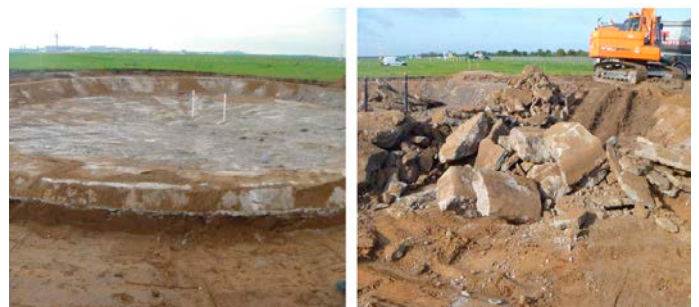
Ehemaliges Feuerlöschübungsbecken

Erste analytische Hinweise auf erhöhte PFAS-Gehalte im Grundwasser liegen im Düsseldorfer Norden seit 2007 vor. In den Folgejahren wurde die Anzahl der auf PFAS untersuchten Grundwassermessstellen schrittweise erhöht und weitere Messstellen errichtet, um eine