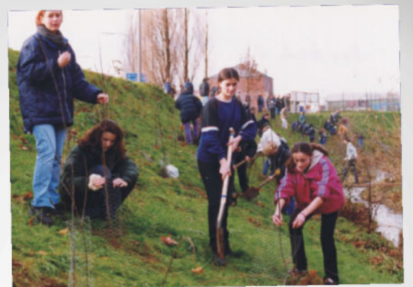
Unterricht mit praktischen Folgen: Aufpflanzaktion