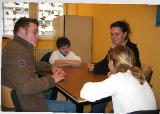
Wie wird Streit geschlichtet? Was hilft da weiter?