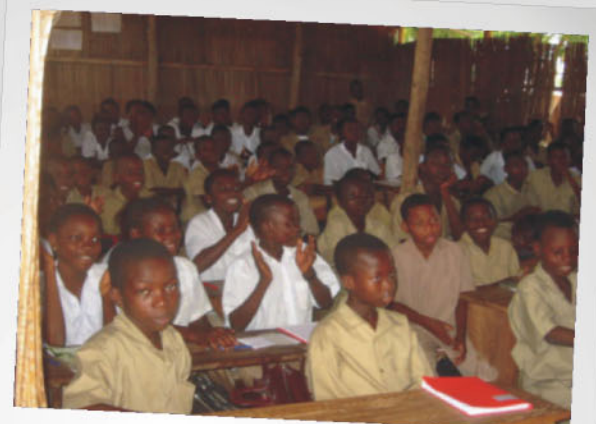
Schulpartnerschaften in der Einen Welt