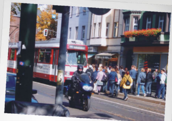
Der Schulweg - preisgünstig, sicher, umweltfreundlich?