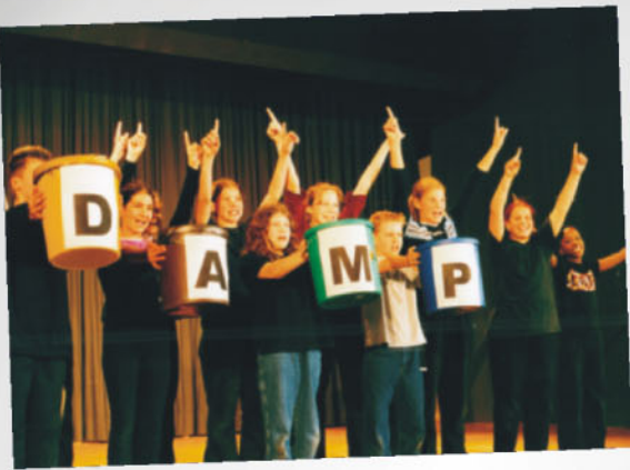
Abfall trennen und damit Geld verdienen