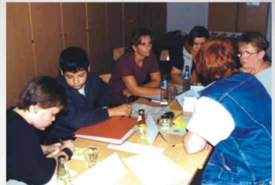
Gemeinsame Arbeitsgruppe von Eltern, Schülern, Lehrern ...