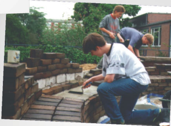
Neuer Treffpunkt auf dem Schulhof - eine Bank entsteht