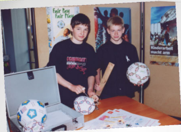
Beschaffung von Fußballen aus fairem Handel