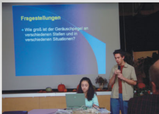
Präsentation von Untersuchungsergebnissen

Anschließend wurden Verbesserungsvorschläge gemacht, die inzwischen zum Teil umgesetzt sind und das Klima innerhalb und zum Teil auch außerhalb der Schulen positiv beeinflussen. Dabei haben Partner außerhalb der Schulen zum Beispiel aus Wirtschaft, Stadtverwaltung und Vereinen mitgeholfen.