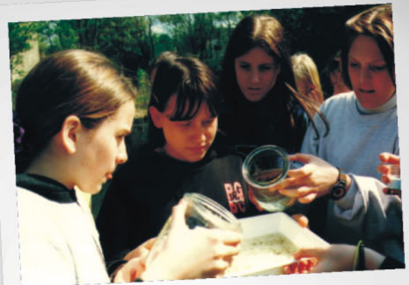
Schulgelände naturnah? Angenehmer Aufenthaltsort?