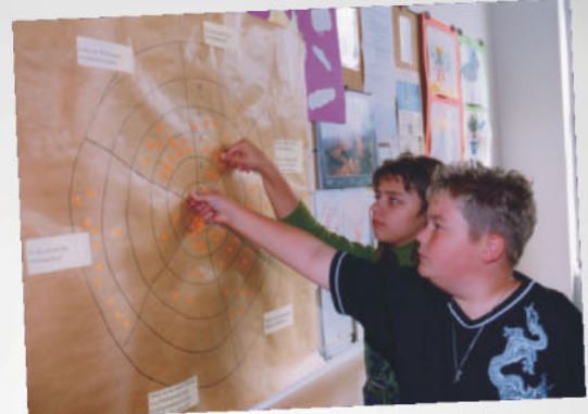
Welche Maßnahme ist vor- dringlich. Jede Stimme zählt!