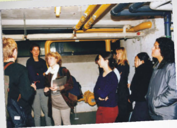
Energieverbrauch in der Schule - welche, wie viel, wie teuer?

16 Schulen aller Schulformen haben seit 1999 beim Projekt der Düsseldorfer Lokalen Agenda "Öko-Audit an Schulen" mitgemacht. Schüler, Lehrer, aber auch Eltern haben die Schulen nach Kriterien der Agenda wie Umweltschutz, soziale Verantwortung, wirtschaftliche Effizienz und Bildungsangebot untersucht.