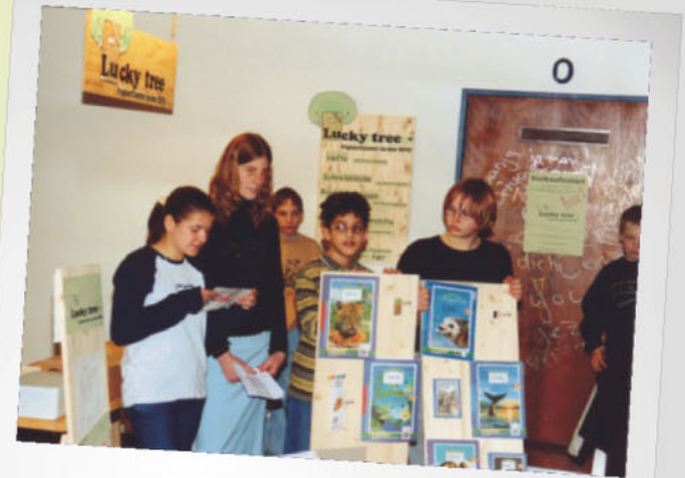
Modernes Lernen: Eine Schülerfirma eröffnet