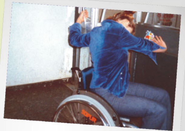
Geeignet für Rollstuhlfahrerin?