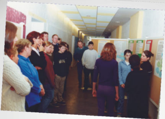
Vorschläge entwickeln, diskutieren, sich einigen